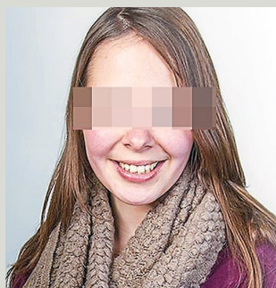
Mit diesem Foto hat die Polizei nach ihr gesucht.