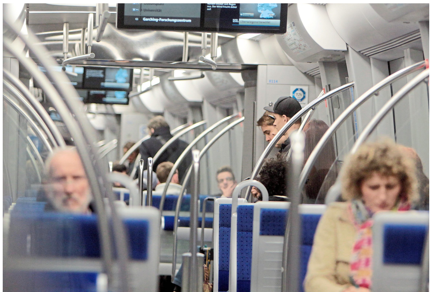
Fahrgäste in einer U-Bahn in München. Besonders belastet sind Haltestangen und -griffe.